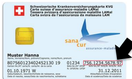
Carte d'assuré maladie