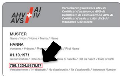
Certificat d'assurance AVS-AI

Pour compléter le formulaire eMesam, vous avez besoin de votre numéro d'AVS. Celui-ci est disponible sur votre carte d'AVS ou sur votre carte d'assuré LAMAL :